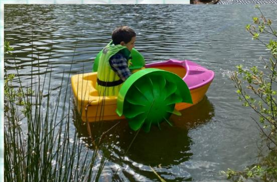
Candáti rok 2024