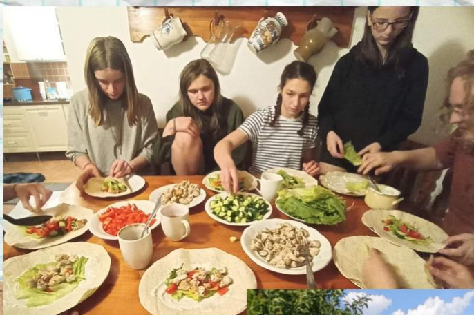
Vydry rok 2024