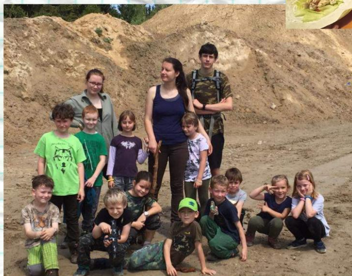
Hraboši rok 2020