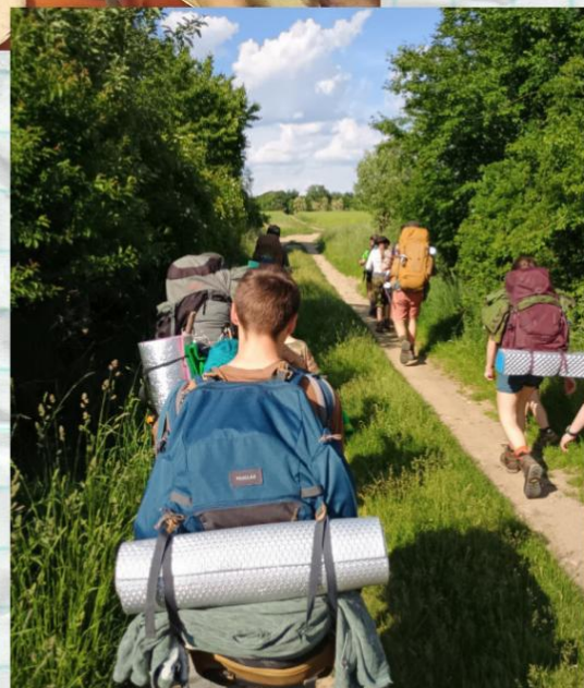
Vlčácký vandr 2025